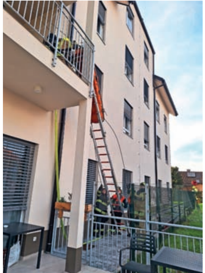
Gasilska vaja v Domu starejših občanov SeneCura Žiri

Hkrati s požarnim alarmom so bile v skladu z načrtom alarmiranja aktivirane tudi vse gasilske enote v občini Žiri. Ob prihodu na kraj so gasilske enote pomagale pri evakuaciji stanovalcev, nato pa z notranjimi napadi v samo mansardo objekta rešile še 12 ponesrečencev, ki so bili zaradi dima in različnih