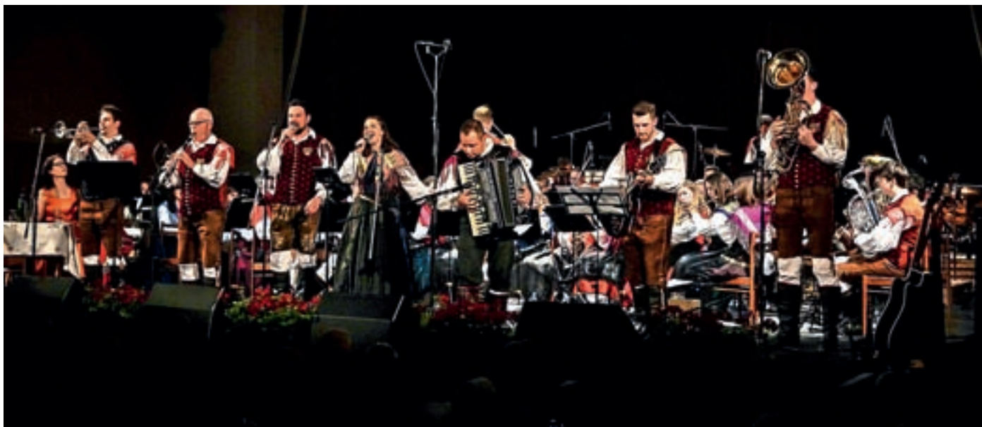
Utrinek z letnega koncerta