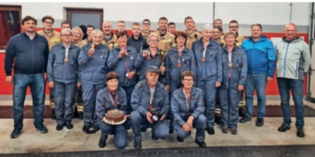
Starejše gasilke PGD Dobračeva z bronastimi medaljami z državnega prvenstva v Gornji Radgoni

Delovno je bilo tudi 21. oktobra, ko so gasilci PGD Dobračeva organizirali tehničnoreševalni dan. Udeležilo se ga je 35 tečajnikov iz domačega in okoliških društev. Člani so pridobivali nova znanja in izmenjavali izkušnje na petih različnih točkah. Urili so se v reševanju iz ruševin in globine ter nudenju prve pomoči ob dveh prometnih in množični nesreči.