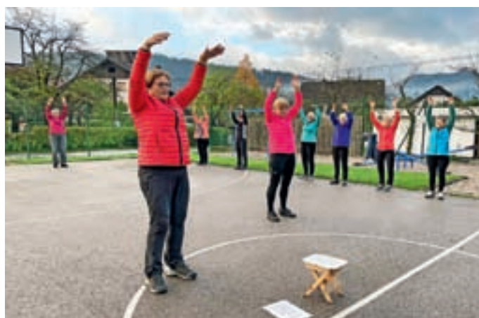
Vadba 1000 gibov po novem poteka tudi v Žireh.