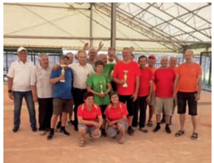
Turnir v balinanju v Žireh