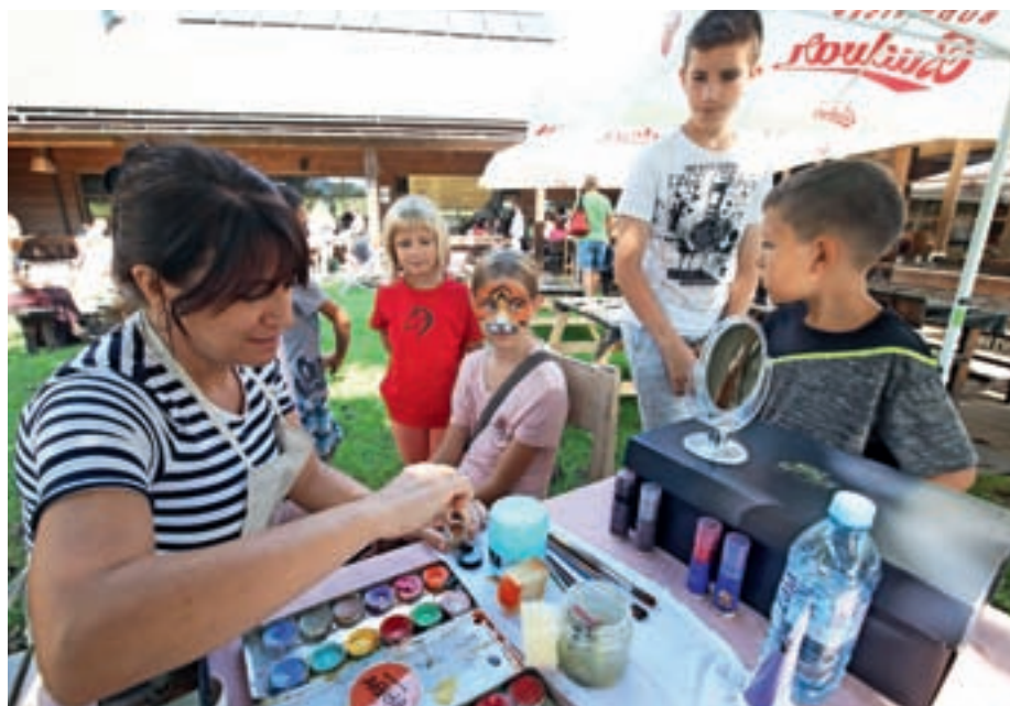
Srečanje rejniških družin v Besnici

Center za socialno delo Gorenjska se zahvaljuje vsem, ki so kakor koli prispevali k izvedbi srečanja. Želijo si, da bi Srečanje rejniških družin postalo tradicionalno.