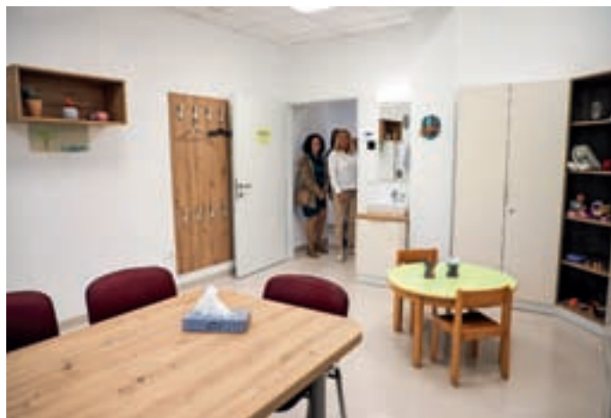
Najemnino za nove prostore Centra za duševno zdravje otrok in mladostnikov ter Razvojne ambulante s centrom za zgodnjo obravnavo sofinancira tudi Občina Žiri.

V škofjeloški Razvojni ambulanti s centrom za zgodnjo obravnavo, ki deluje v okviru Zdravstvenega doma Kranj, preverjajo kakovost otrokovega razvoja, odkrivajo odstopanja od običajnega razvoja ter otrokom in njihovim družinam nudijo timsko usklajeno podporo