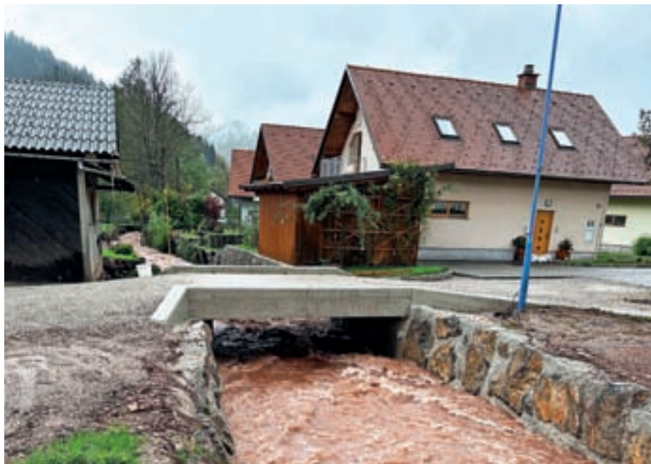
Novi most pri Primcu

Ta čas je tako kar nekaj cest, in sicer v skupni dolžini kilometer in pol, pripravljenih za asfaltiranje – zgrajeni so oporni