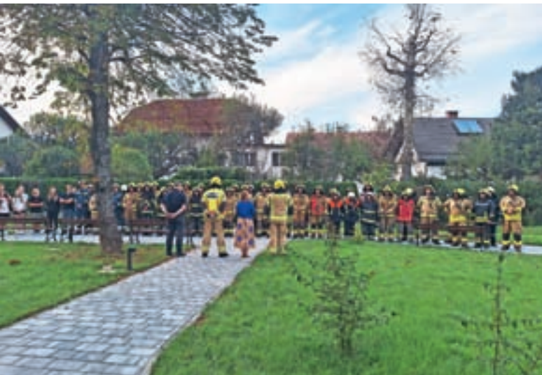
Pri organizaciji vaje smo se povezali z lokalnimi gasilskimi društvi.

poškodb ujeti v objektu. Vlogo ujetih v požaru so uspešno odigrali člani podmladka gasilskih društev. Izvedeni so bili notranji napadi po glavnem stopnišču in po požarnih stopniščih, v akciji so rešili osebe, ki so ostale ujele na balkonu, pogasili požar ter na koncu prezračili in pregledali celotno nadstropje. Vodenje vaje se je izvajalo prek poveljniškega mesta v vozilu PGD Dobračeva. Zaradi velikosti objekta pa je bilo delovišče razdeljeno na dva ločena sektorja, v vsakem od sektorjev sta delovali dve gasilski enoti.