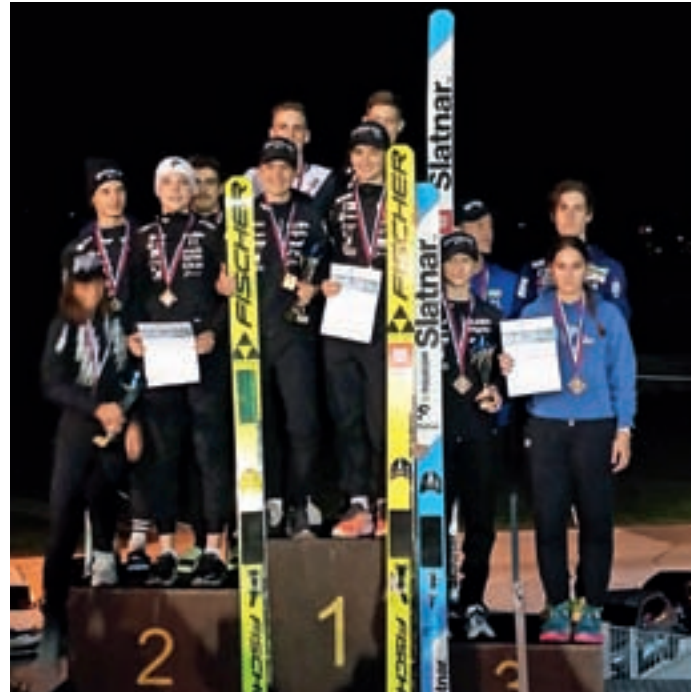
Zmaga ekipe SSK Norica Žiri na članskem državnem prvenstvu v Kranju

V Nordijskem centru Poclain je september minil precej delavno in smo presegli 1000. delovno uro zaradi avgustovskih poplav.