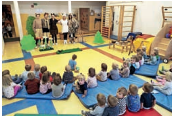
Vzgojiteljice so malčke v jaslih razveselile z igrico Zrcalce.